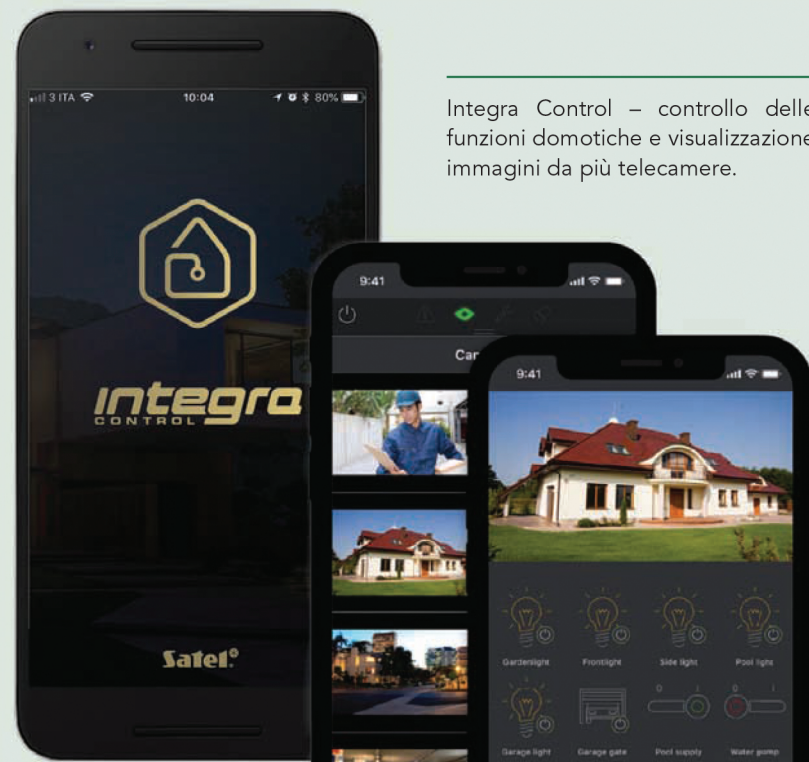
Integra Control – controllo delle funzioni domotiche e visualizzazione immagini da più telecamere.

Le centrali INTEGRA soddisfano i rigorosi standard europei EN 50131 GRADO 3. Tutti i dispositivi sono sottoposti a un controllo di qualità a più step, per assicurare che la produzione avvenga seguendo elevati standard funzionali.