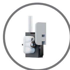
BRACKET E-6 Tamper