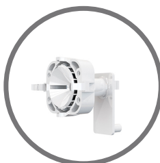
BRACKET E-5 Supporto con snodo a sfera