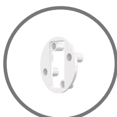
BRACKET E-2B Inserto