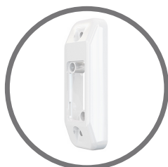
BRACKET E-4 Base