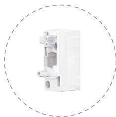
BRACKET E-3 Distanziatore 30 mm max 5 pezzi

Completa la staffa con gli accessori a seconda del tipo di installazione